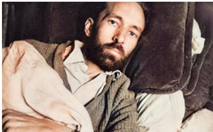
René Daumal 1944